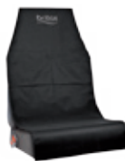
Protector para asiento del vehículo