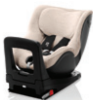
Funda de verano (varios colores)